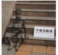
K. Lee, L'invisibilità della povertà

Moduli da sviluppare in Unità di Apprendimento