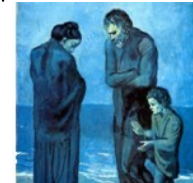
P. Picasso, Poveri in riva al mare