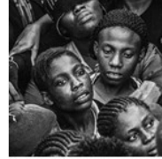
F. Zizola, In the same boat