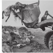
S. Salgado, Rwanda