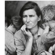
D. Lange, Migrant mother