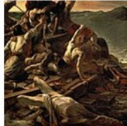
T. Géricault, La zattera della medusa