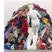
M. Pistoletto, La Venere degli stracci