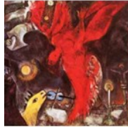
M. Chagall, La caduta dell'angelo