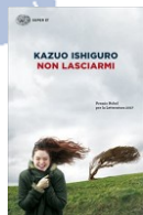
K. Ishiguro Non lasciarmi