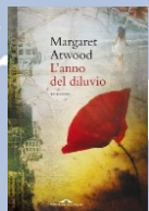
M. Atwood L'anno del diluvio