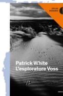
P. White L'esploratore Voss