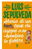
L. Sepúlveda Storia di un cane che insegnò a un bambino la fedeltà