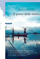
A. Ghosh Il paese delle maree