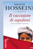
K. Hosseini Il cacciatore di aquiloni