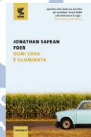
J. Safran Foer Ogni cosa è illuminata